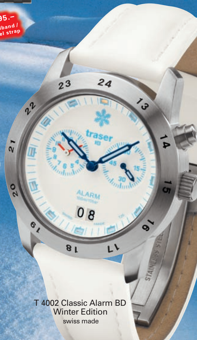
T 4002 Classic Alarm BD Winter Edition swiss made

Leder weiss mit Sicherheitsschliesse 21 / Leather white with safety folding clasp 21 Stahl Classic 13 / Steel Classic 13